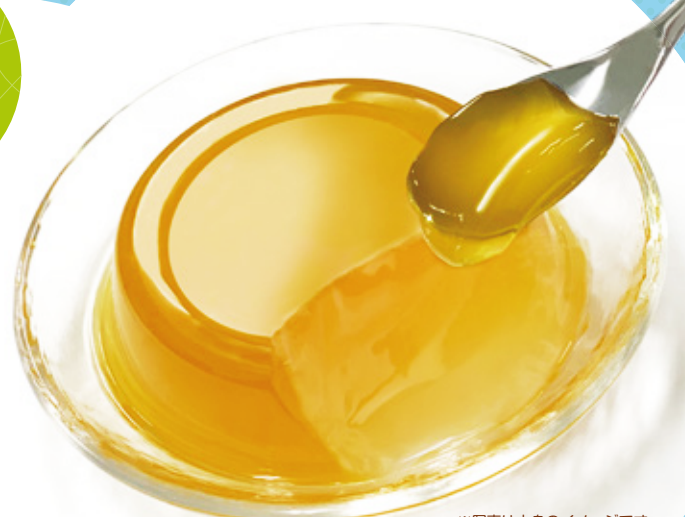
※写真は中身のイメージです (パイン&オレンジ味)